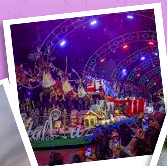
Créditos: Natal Luz de G